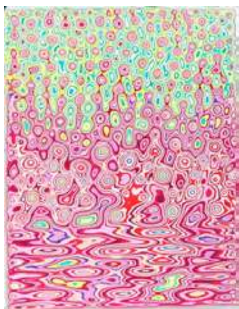
Jang Kwang Bum, Reflet P, 2019 Acrylique sur toile et ponçage, 33,5 x 24,5 cm