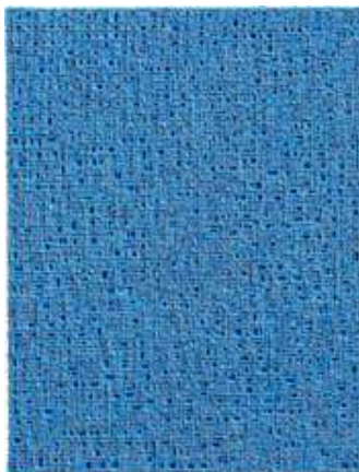
Kim Tae Ho, Internal Rythm 2015-9, 2015 , Acrylique sur toile, 91,5 x 73 cm