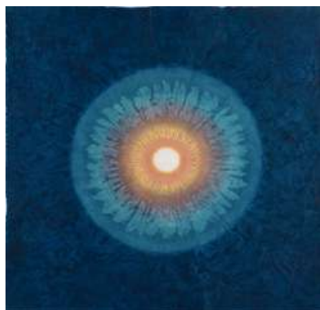
Bang Hai Ja, Naissance de lumière, 2014 Pigments naturels sur papier, 127 x 128 cm