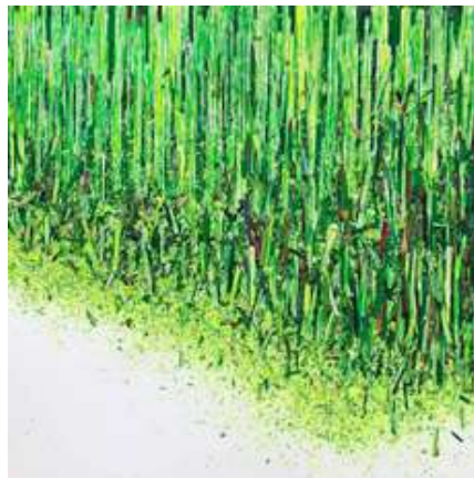
Hur Kyung-Ae, Sans titre, 2019 , Acrylique sur toile, 50 x 50 cm