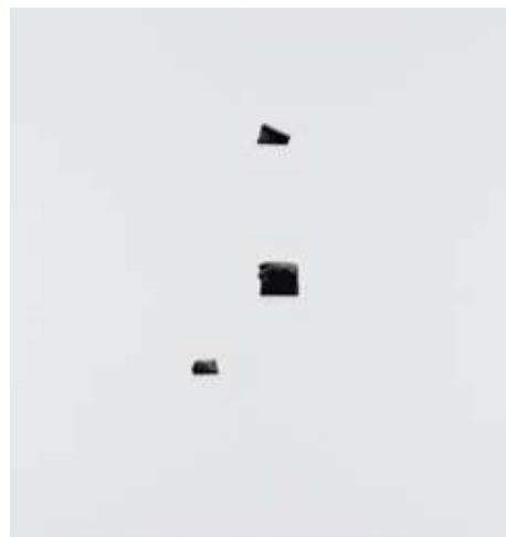
Choi Jun-Kun, Sea, 2016 , encre de Chine sur toile, 10 x 150 cm