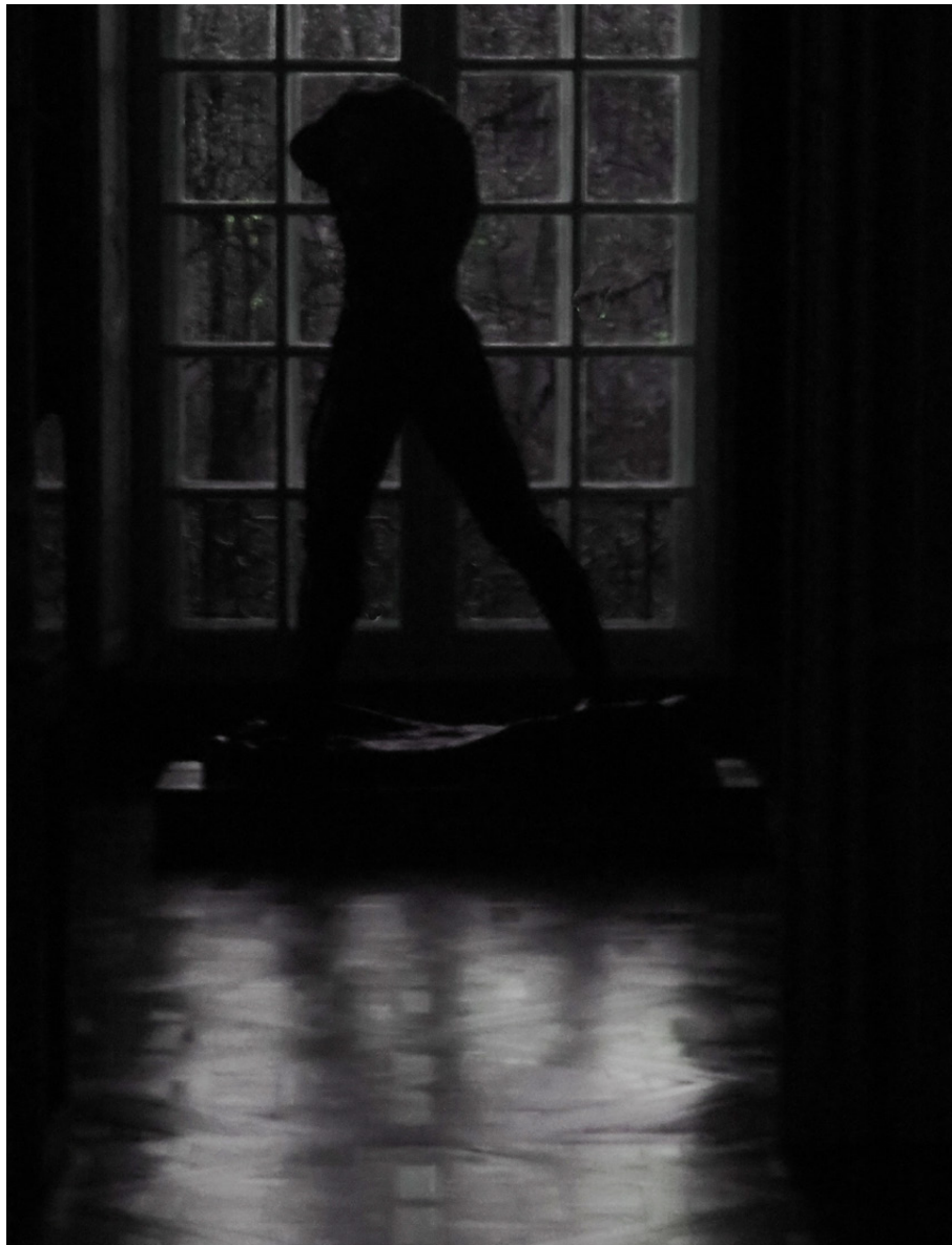
L'homme qui marche, 2016 220 x 160 cm tirage /6