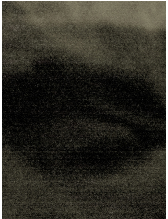
L'oeil de Wissant, 2016 220 x 160 cm tirage /6

Artiste pluriel, il poursuit une esthétique personnelle au fil d'installations vidéos « Avis Alba » en 2014 « Hic Tamen Vivit » en 2016. Il crée également des scénographies pour le château de Versailles, « 18', aux Sources du Design » en 2014, « Fêtes et divertissements à la Cour » en 2016. Il se consacre aussi à l'écriture, sa première pièce de théâtre, « Ad Vitam Aeternam » est éditée en 2015 par Michel de Maule.