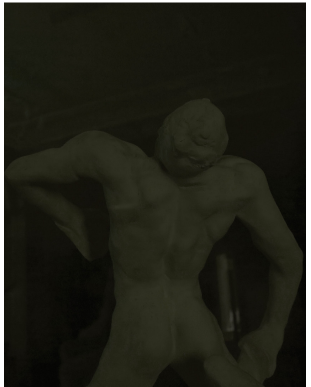
La Chute, 2015 60 x 55 cm tirage /12

« Plus d'un siècle plus tard, par défi mais aussi par jeu, Patrick Hourcade suit les traces de Steichen, changeant au passage quelques règles. Il déplace le cadre de Meudon à Paris et recherche la sombre densité nocturne, celle qui impose un temps d'adaptation pour voir émerger les formes sculptées dans les salles de l'hôtel Biron ou le sous-bois du jardin. Mais comment obtenir une nuit noire au cœur de Paris, au pied de la coupole des Invalides brillant de tous ses ors ? Patrick Hourcade traque les rondes bosses, l'objectif recouvert d'un bas noir comme le visage d'un pilleur d'images. Il s'approche au plus près des œuvres pour en saisir un angle inattendu, un cadrage particulier. »