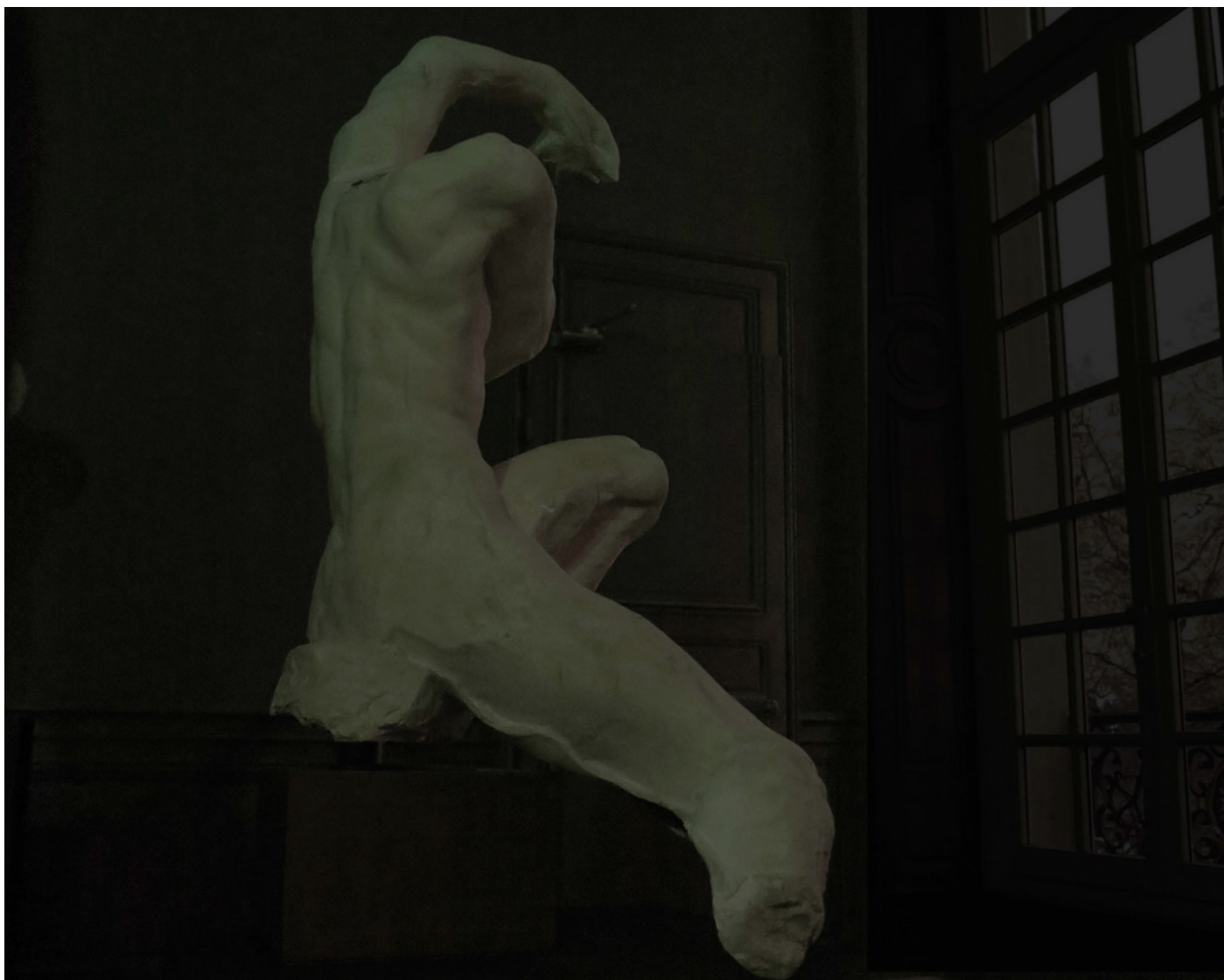
Le fils d'Ugolin, 2016 160 x 220 cm tirage /6